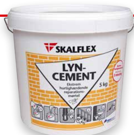
5 kg, DB-nr: 1526015